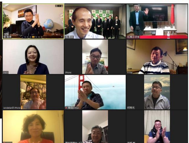
北海道中国工商会理事例会卓話：華僑華人の富をつくる術 20200408